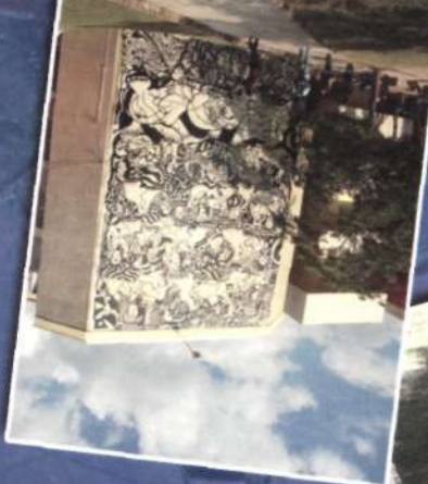
Biblioteca, Centro Universitario Regional del Litoral Atlántico (CURLA)