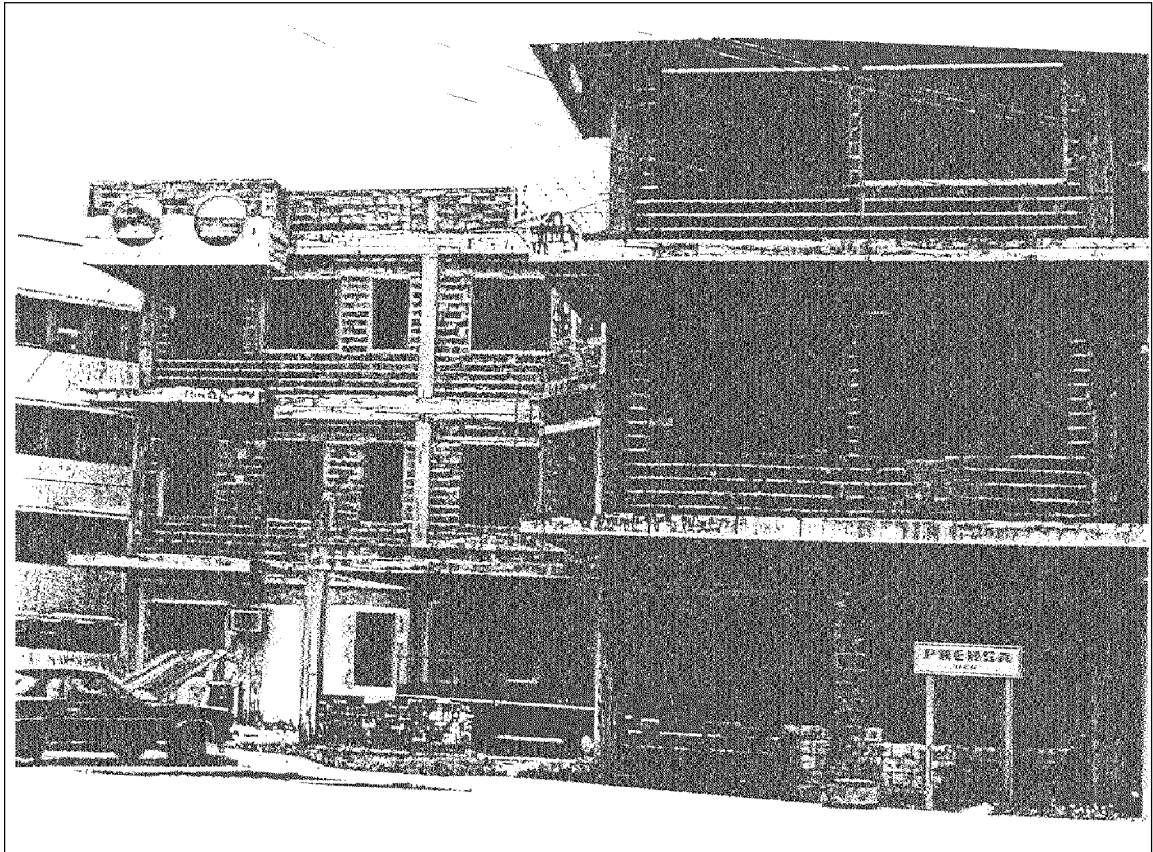
FOTO 6.1 VISTA PARCIAL DE LA FACHADA ESTE DE LA UNIDAD DE NEFROLOGIA