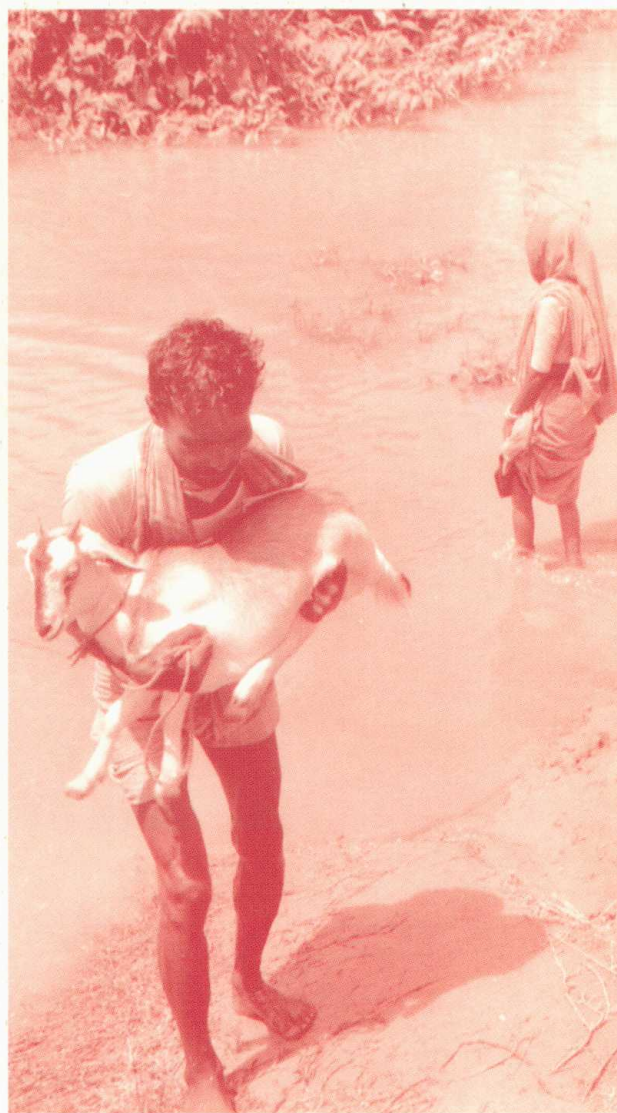
Inundaciones: Obligados a vivir en zonas de riesgo de inundaciones, las poblaciones más vulnerables luchan para proteger sus bienes y reconstruir sus vidas tras la inundación. Bangladesh, 1969

La contribución de ECHO se elevó a 18.000 ecus.