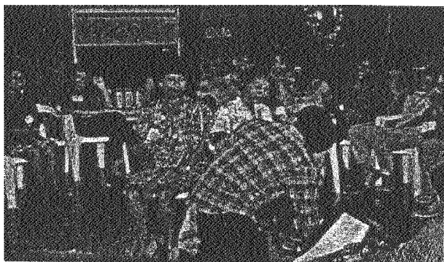
Tablas XXXVI : Talleres de capacitación