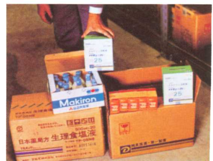
備蓄医薬品 Medical supplies stockpile

The national government, local governments, the Japan Red Cross Society, and related industries proceed to improve on the procurement and stockpiling of medical supplies required for medical relief activities in case of a disaster.