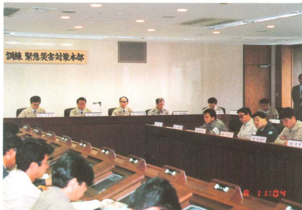
本部運営訓練（平成9年度） Headquarters Management Exercise (1997)

Such activities consist of public information by means of radio and TV broadcast, lending out of disaster prevention movie films, holding events in the Disaster Prevention Week and lecture sessions, distributing pamphlets, etc.