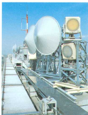
中央防災無線 Central D.P.R.C.N.

防災無線網には、国土庁が整備を推進している中央省庁等の間を結ぶ中央防災無線、消防庁と都道府県庁間を結ぶ消防防災無線、各都道府県及び市町村が地域防災計画に基づく防災情報の収集・伝達を行うために構築している防災行政無線等があります。