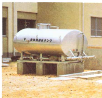
応急給水槽 Emergency Water Tank

国、地方公共団体、日本赤十字社、関係業界等により、医療救護活動に必要な医薬品、医療資機材の調達、備蓄体制の整備が進められています。