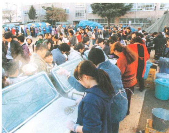
ボランティア活動（阪神・淡路大震災） Voluntary Activities the time of the great Hanshin-Awaji Earthquake

With this in mind, the government designated January 17 as national "Disaster Prevention and Volunteer's Day" and the week of January 15 to 21 as national "Disaster Prevention and Volunteer's Week". These are designed to raise awareness of the volunteer and autonomous work performed during disasters among Japan's citizens and the various regional disaster prevention agencies and authorities, and to thereby enhance preparations for disasters. Disaster prevention related agencies and authorities hold some events in and around this week.