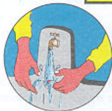
Lávate las manos después de usar la letrina