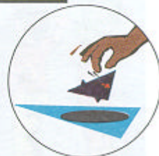
Arroja el papel usado al hueco