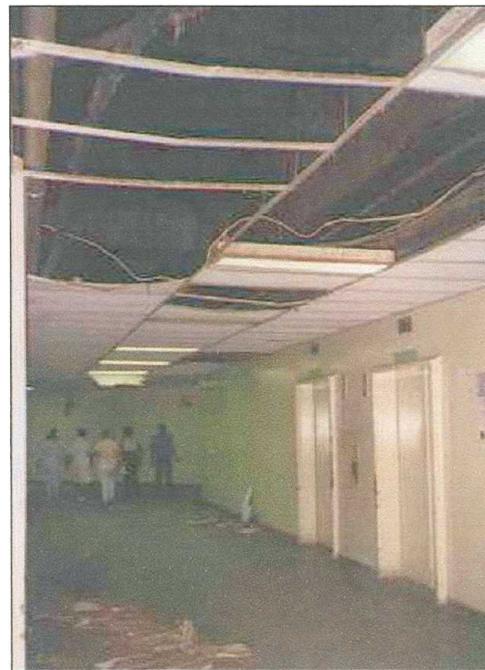
Foto 72. Daños en Cielos Falsos.