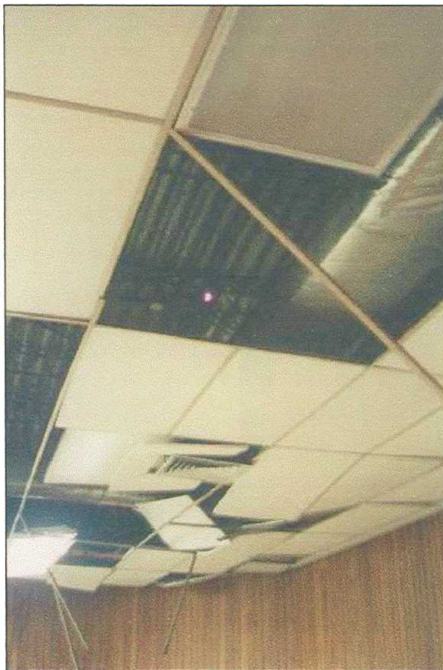
Foto 71. Daños en Cielos Falsos.