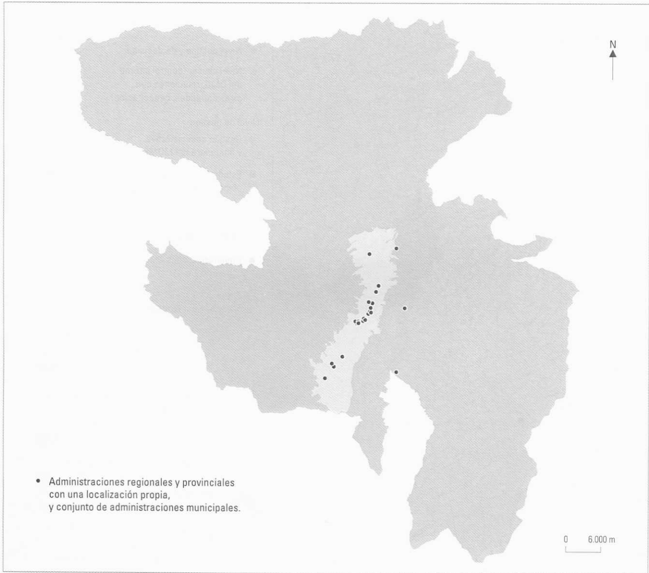
Mapa 15-4 Los lugares esenciales de la administración regional, provincial y local