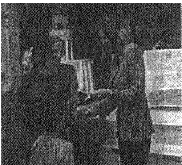
Protección del Gasto Social.

Asimismo, para coadyuvar en la expansión y modernización del gasto social, el Gobierno firmó el 27 de septiembre de 1999 un contrato de préstamo con el BID, el cual proporcionará recursos por US$30 millones en apoyo de un Programa de Transición y